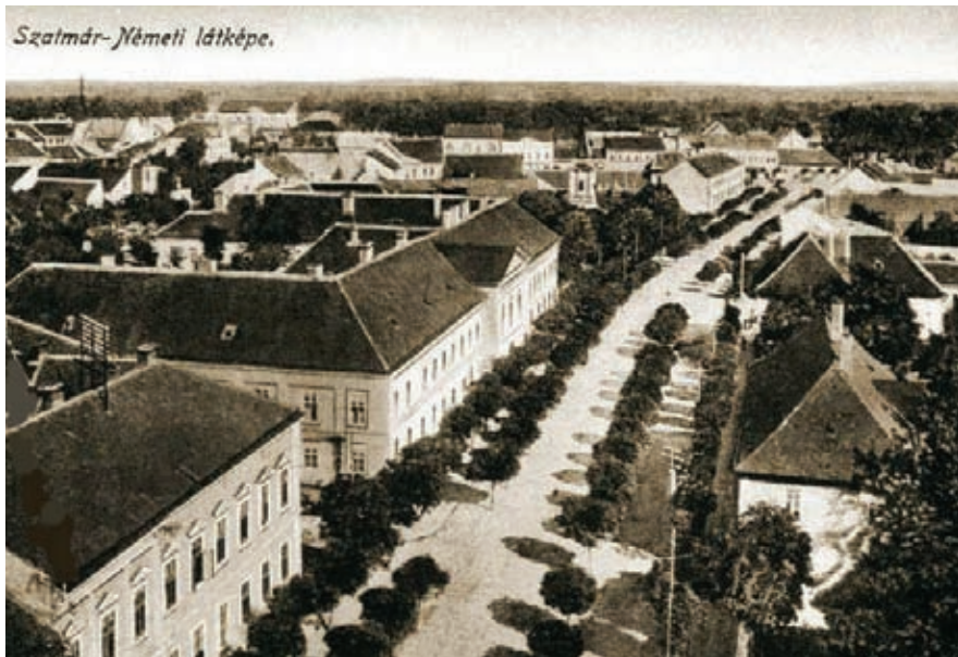
A püspöki palota épülete madártávlatból

ajándékozta. Az értékes kollekciónak betűrendes katalógusát Meszlényi püspök 1900-ban adta ki attól a gondolattól vezérelve, hogy – amint a katalógushoz írt előszóban állítja – „a könyvtárak az elrejtett kincshez hasonlítanak, ha az azokban őrzött könyvek lajstroma nem létezik.”