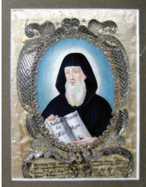
Szent Benedek (apácamunka, püspöki képtár)

A püspöki képtár anyaga felújításának gondolata a jubileumi kiállítás (2004) kapcsán merült fel, s ez a rendkívül összetett és igényes munka azóta folyamatosan, megszakítás nélkül zajlik a restauráló műhelyben.