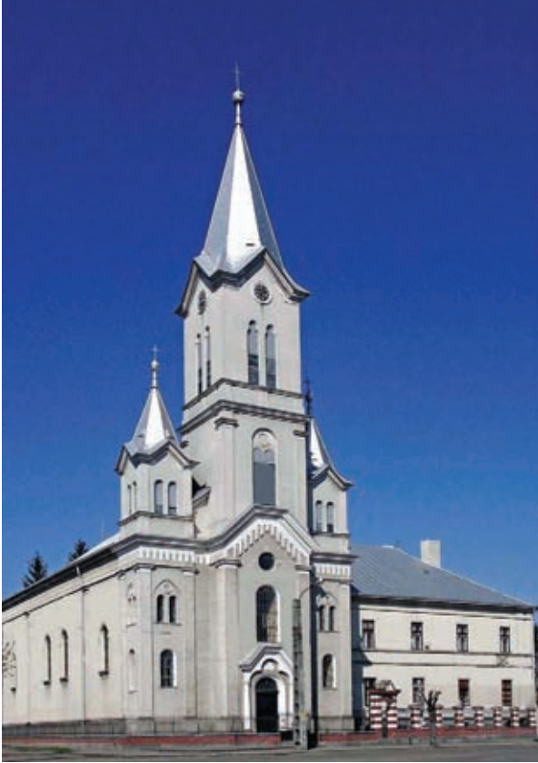
A szatmári Szent János templom

Meszlényi Gyula 1901-ben döntött a templom építéséről. A feljegyzések szerint a püspök Ungba utazott, hogy megvásárolja a Sztáray grófok kastélyát nyaralónak, útja során azonban meggondolta magát és úgy döntött, hogy vásárlás helyett templomot épít. A korabeli feljegyzések arról tudósítanak, hogy az építkezés 1902 tavaszán kezdődött el azokon az alapokon, amelyeket egykor Hám János emeltetett.