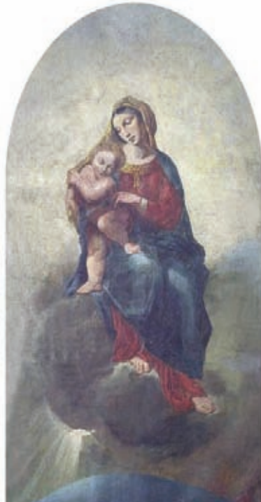
Hollósy Simon rónaszéki oltárképe

Ebben az időszakban készítették a Zárdatemplom két impozáns, kiváló szakmai, technikai tudással kialakított mellékoltárát, a Szent József és a Jézus Szíve oltárt.