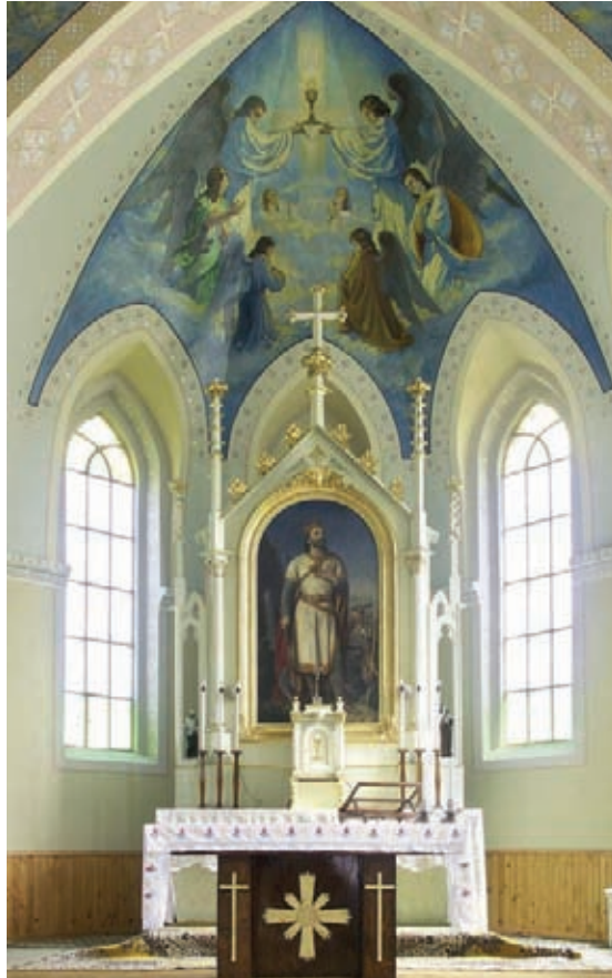
A nagysomkúti római katolikus templom szentélye Barabás Miklós oltárképével

A szatmári római katolikus egyházmegye büszkesége, a nagysomkúti templom Szent Lászlót ábrázoló oltárképe, amelyet a kor egyik legkiválóbb magyar művésze, Barabás Miklós készített 1891-ben.