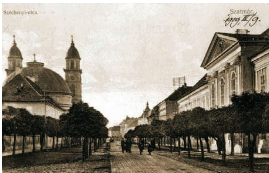
A Széchenyi-utca a püspöki palotával (1909)

Az építészeti szempontból nem mindig kiemelkedő, de egyházi szempontból rendkívül fontos megvalósítások mindegyikének szám-bavételekor fájó szívvel állapíthatjuk meg, hogy a püspök által épített vagy renováltatott 24 templom közül 13 ma már nem tartozik az egyházmegyéhez, de bemutatásukra helyszűke miatt sem vállalkozhatunk.