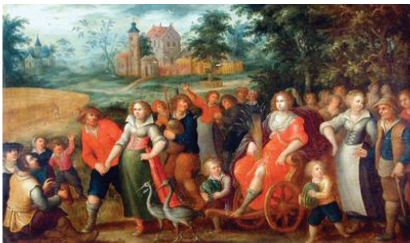
Ismeretlen szerző: Ceres diadalmenete (Pannonhalma, Főapátsági Gyűjtemény)