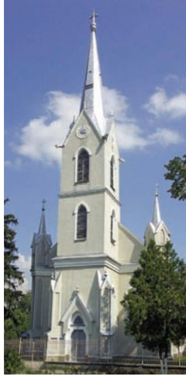
A nagysomkúti római katolikus templom

1896-ban elkészült a székesegyházi plébánia palotaszzerű épülete.