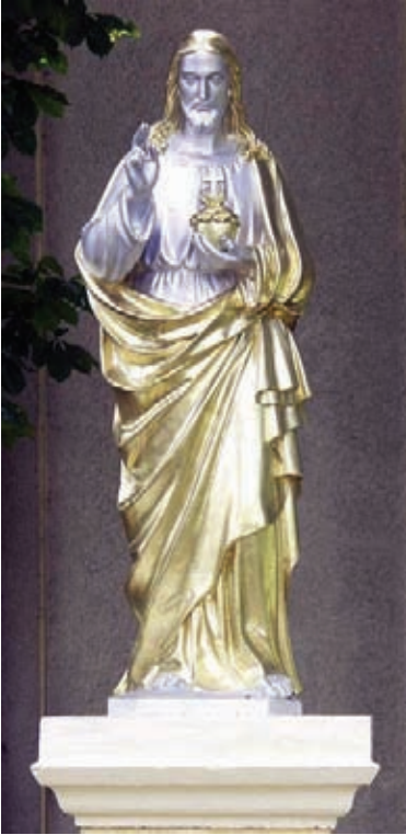
A kálmándi Jézus Szíve-szobor