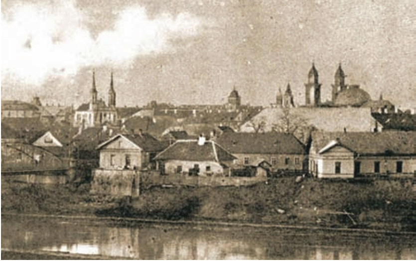
Szatmárnémeti látképe a XIX. század végén

„1898. február 1-jén mintegy 2000 szegény kapott tűzifát.” (Névsoruk a plébánia irattárában). 5