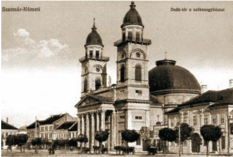
A szatmári Székesegyház a XX. század elején