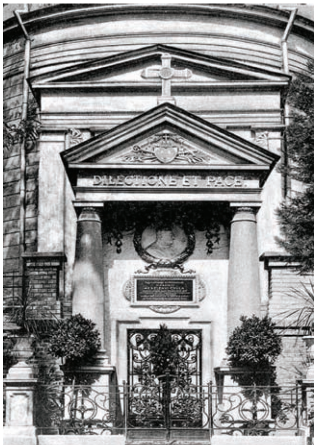
Ilyen volt a Meszlényi-mauzóleum felavatásakor.