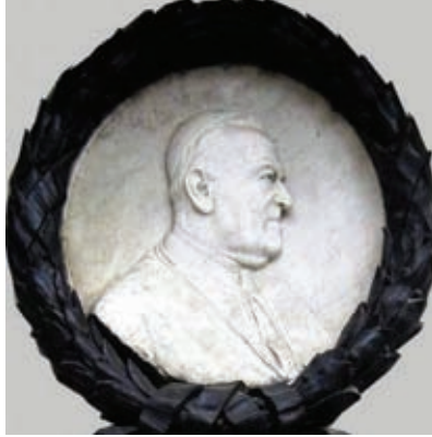
A Mészlyeni Gyulát ábrázoló dombormű a mauzóleum bejáratánál

illetve a Scherling vagy a Tóth Gyula által készített arcképeken. Ennek a szerzőjét eddig még nem sikerült azonosítani, nagy valószínűséggel ugyanaz lehet, mint a díszes bejárat (mauzóleum) tervezője. Karakteres, szép formavilágú, kiváló szakmai szinten mintázott dombormű látható itt.