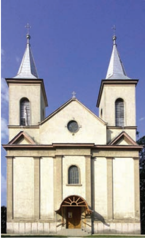
A józsefházi római katolikus templom