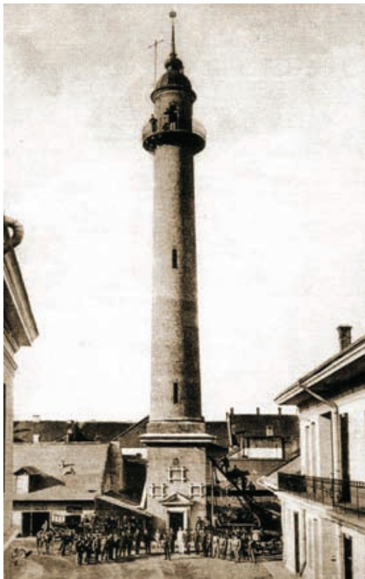
A Tűzoltótorony avatása (1904)

lis épületeinek dominánsan újklasszicista, de olykor az eklektikával is rokonítható stílusa. Ekkor épült Szatmárnémeti állomása, a törvényszék épülettömbje, a régi városháza, a Faipari Iskola, a városi színház, két kaszárnya, az Osztrák-Magyar Bank épülete, a posta, több állami népiskola. Lényegében ezekben az években alakult ki a város építészeti arculata.