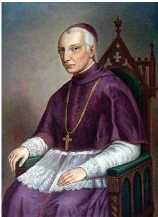
Zahorai János: Hám János arcképe (szatmári Zárdatemplom)

Ugyancsak a püspök megbízásából Irsik Ferenc megírta a Boldog emlékü Hám János szatmári püspök élete 2 című könyvet.