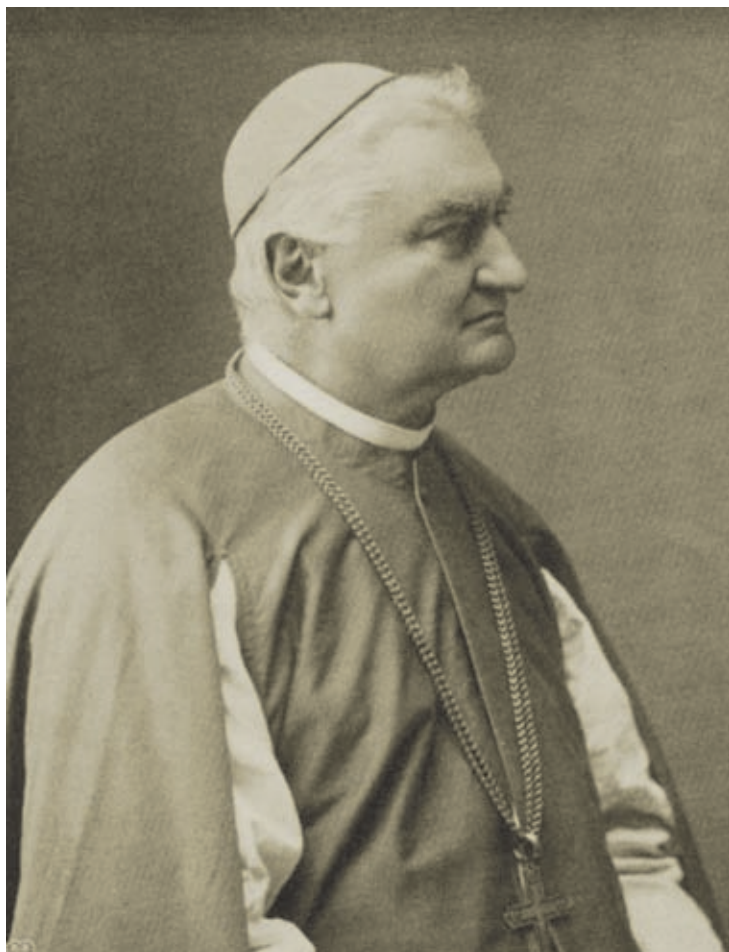
Fényképfelvétel Meszlényi Gyuláról (1905)