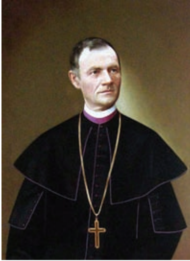
Zahorai János: Irsik Ferenc arcképe (püspöki képtár)

papi hivatás mellett több területen is bizonyították hozzáértésüket, rátermettségüket.