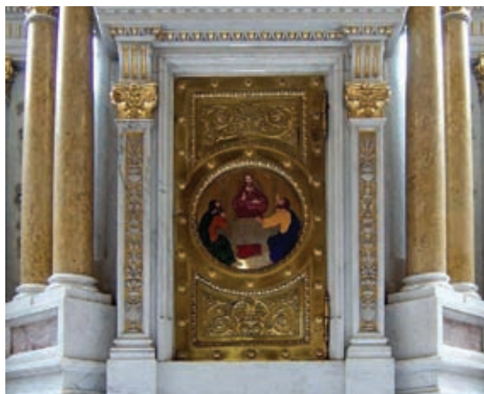
A székesegyház főoltárának szentségháza

Gyönyörű orgonák kerülnek ebben az időszakban az egyházmegye templomaiba. Ekkor készült a budapesti Ország Sándor orgonája