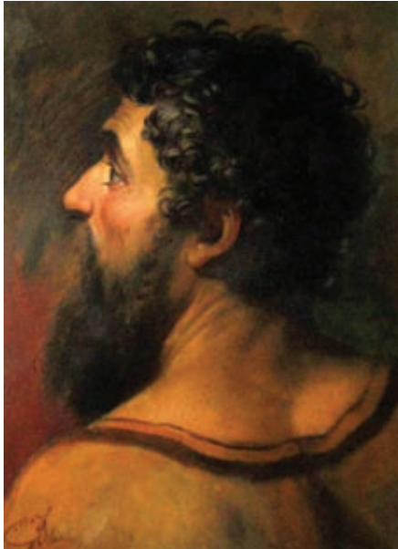
Karl von Blaas: Szent Péter (tanulmány, püspöki képtár)

Ekkor került a képtárba Karl von Blaas Szent Pétert ábrázoló tanulmánya, a Szent Jeromos című festmény, vagy az egyik legszebb, legértékesebb alkotás a gyűjteményből, a XVII. századi Golgota című kompozíció.