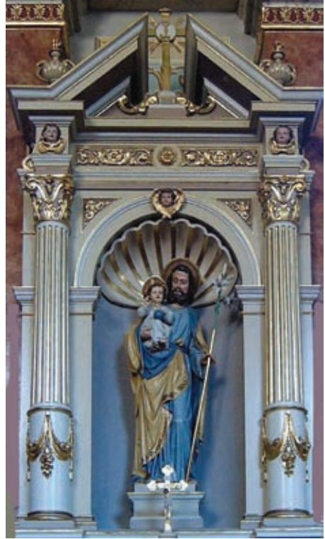
A Zárdatemplom Szent József-oltára