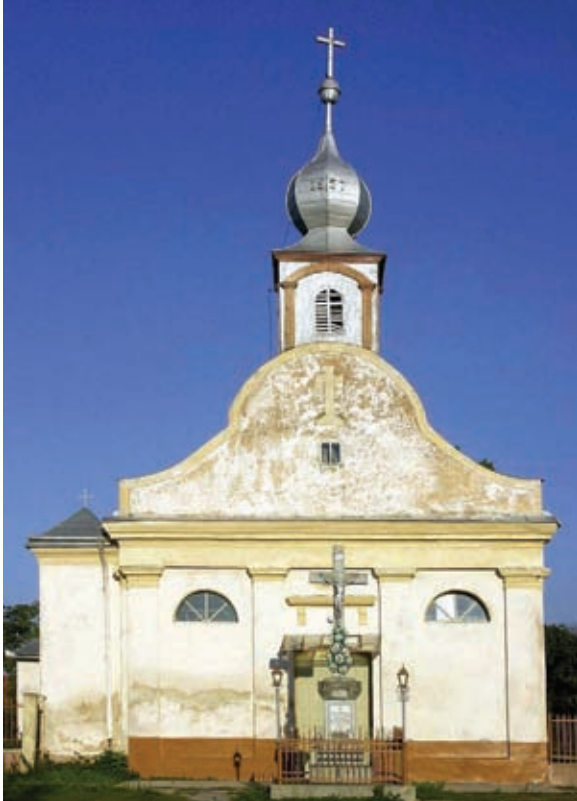
A gilvácsi római katolikus templom

jelentős hányadát építtette újjá, illetőleg gyarapította az egyházmegyét újabb templomokkal, iskolákkal, plébániaépületekkel.