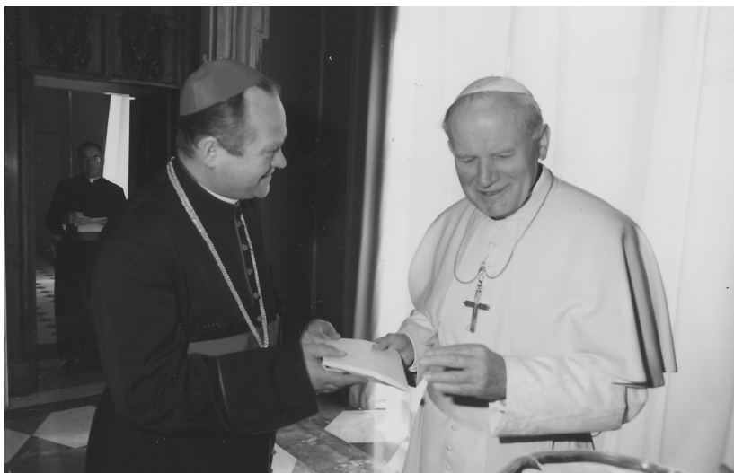
„Ad limina” látogatáskor a Szentatyánál 1996-ban

Az egykori szatmári egyházmegye Kárpátalján található részének, plébániái egyházzjogi helyzetének végleges megoldása gyakorlatilag szinte egybeesik egyházmegyénk megújulása első időszakának korszakhatárával. 57