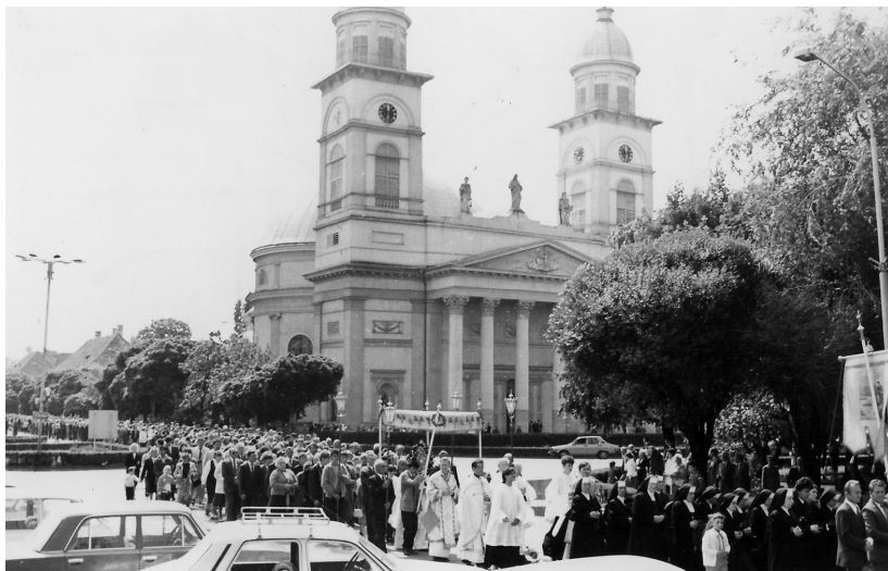
Jézus Szíve körmenet Szatmárnémetiben