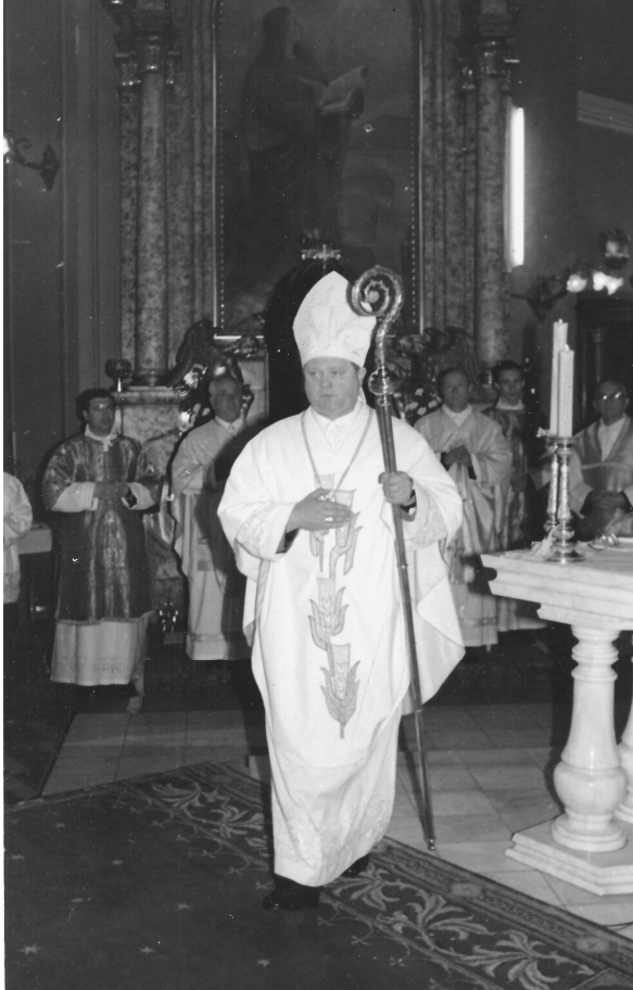
Szentelési beszéde elmondására indul

Eszébe jutott az, amit XXIII. János pápa mondott el újságíróknak azokról a vívódásokról, amelyeket pápává választása után ő átélt. A pápa akkor egy álmatlan éjszakáján feltette magának a kérdést: