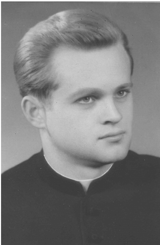
A fiatal lelkész

A Zárdatemplom lelkészeként jó lelkipásztor volt, híveivel közvetlen, barátságos kapcsolatot teremtett. A szentmisék után igyekezett minél több hívével néhány szót váltani. Prédikációi lelki – tartalmi mondanivalójának elfogadását előadása stílusa, beszédének bársonyos hangszíne is segítette.