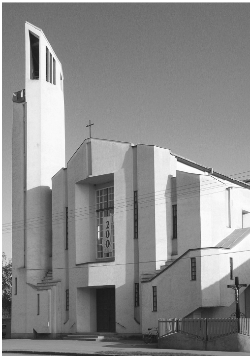
A Nagykárolyi „Fatimai Világapostolátus” plébánia temploma

20. Az (1996. okt. 12-én épült) nagykárolyi Fatimai Szűz Mária plébánia-templomot a megyés püspök 1998. X. 11-én Egyházmegyei kegytemplommá nyilvánította. Egy év múlva pedig a kegytemplom a Fatimai Világ-Apostolátus romániai központjává lett.