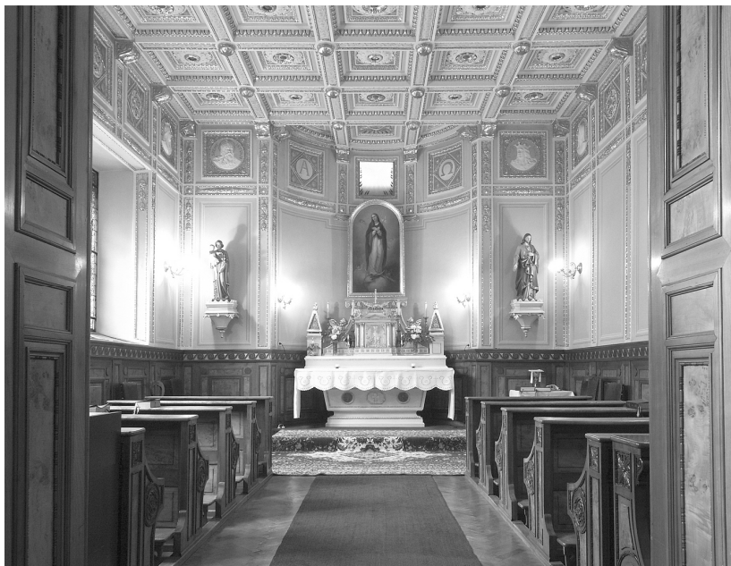
A püspöki kápolna

A nyugdíjba menő, megöregedett papokról való szociális gondoskodás megoldására a püspök nyugdíjas papok otthona építését kezdeményezte. A nyolc nyugdíjas pap elhelyezésére, ellátására alkalmas Szent József Papi Otthon 1992-ben készült el. 242